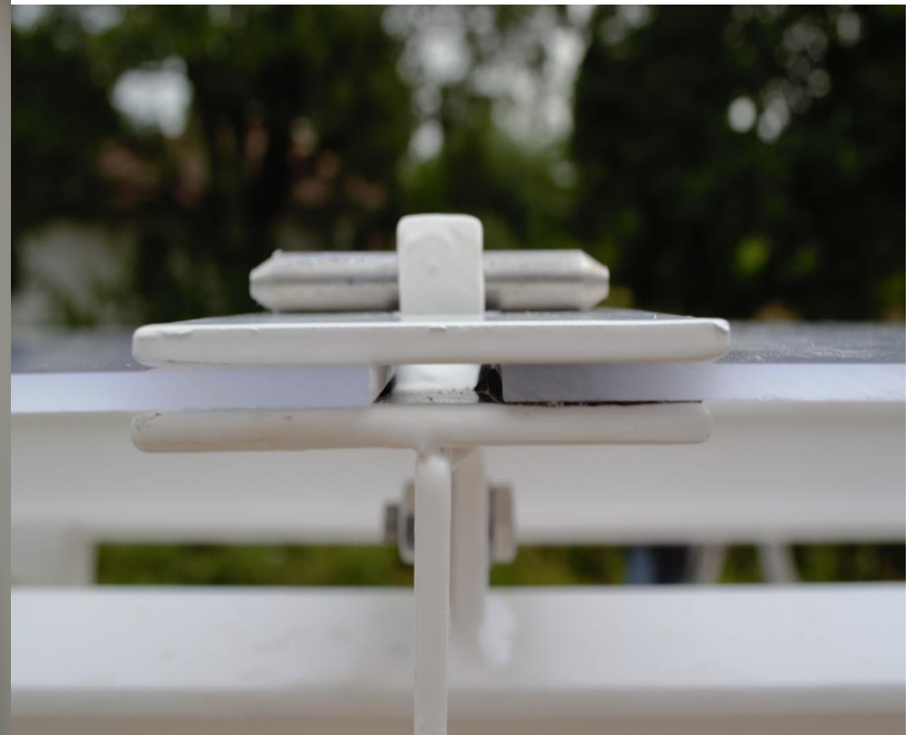
PARTICOLARE POLICARBONATO - MODELLO: ONDA XL – COPERTURA: POLICARBONATO 4mm