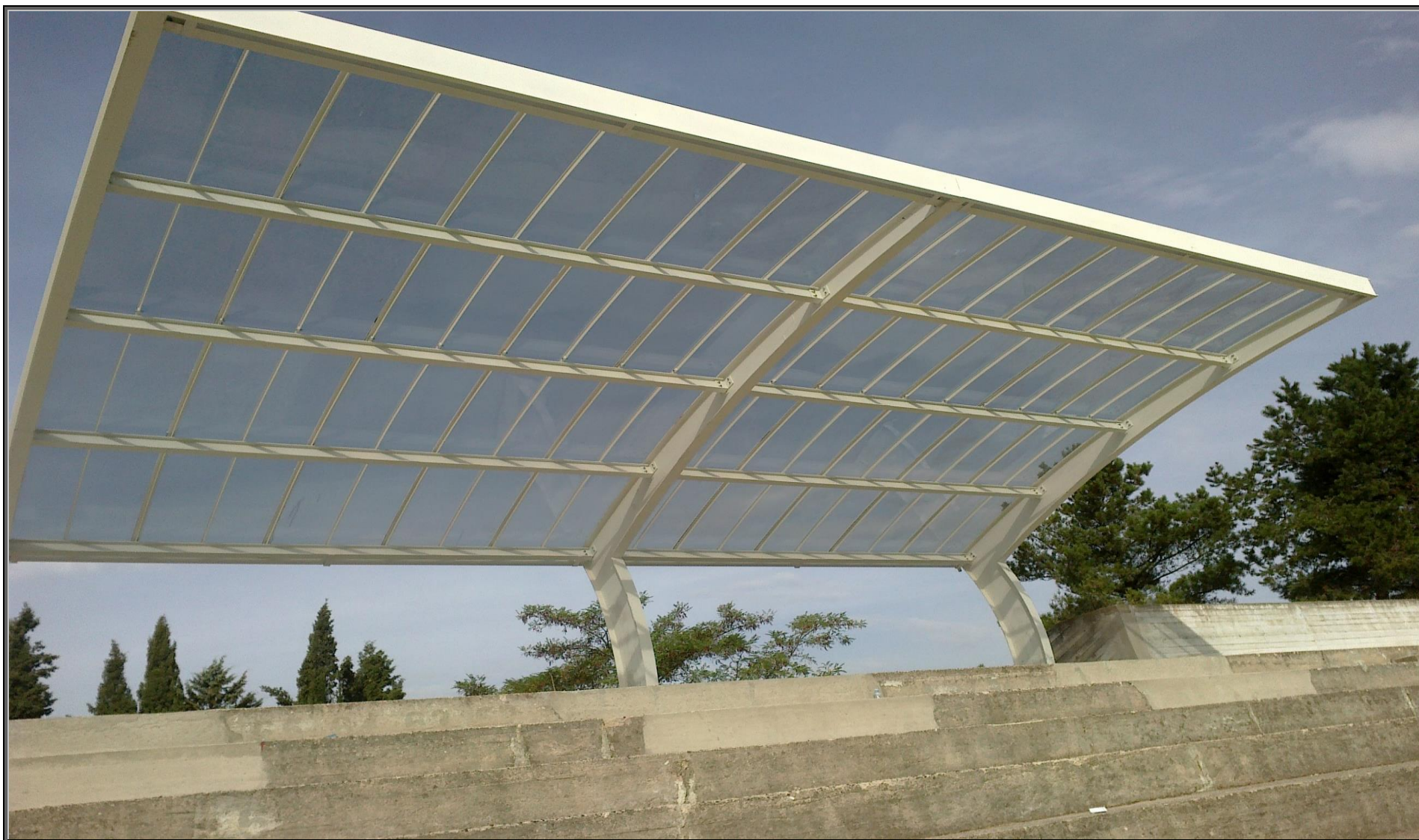
MODELLO: ONDA BASIC – COPERTURA: POLICARBONATO 4mm