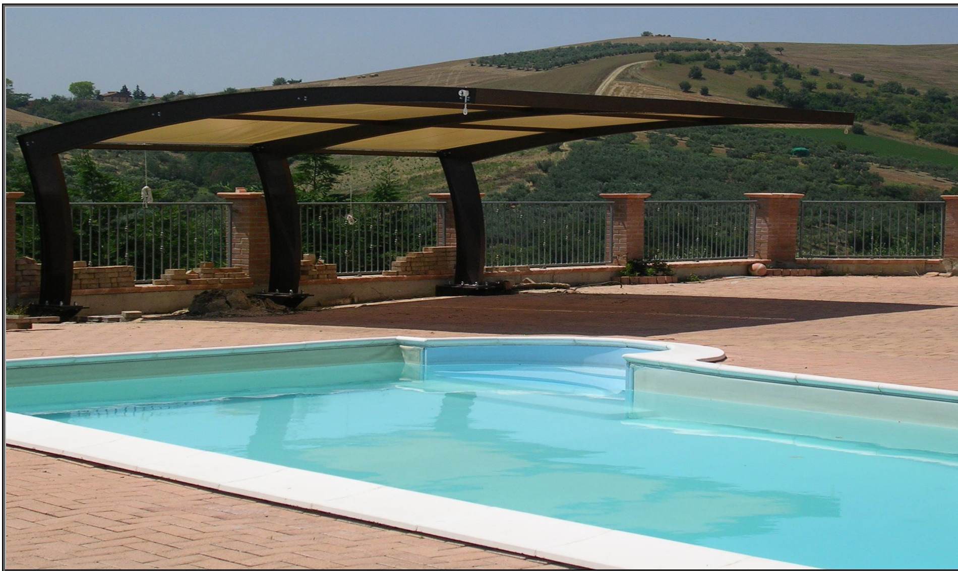
MODELLO: ONDA BASIC – COPERTURA: POLIESTERE