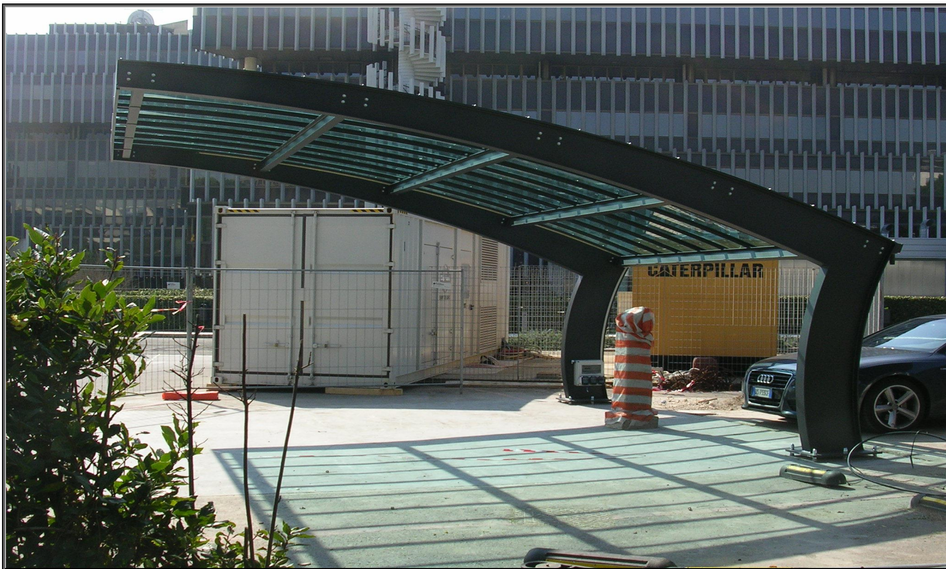
MODELLO: ONDA BASIC – COPERTURA: POLICARBONATO 4mm