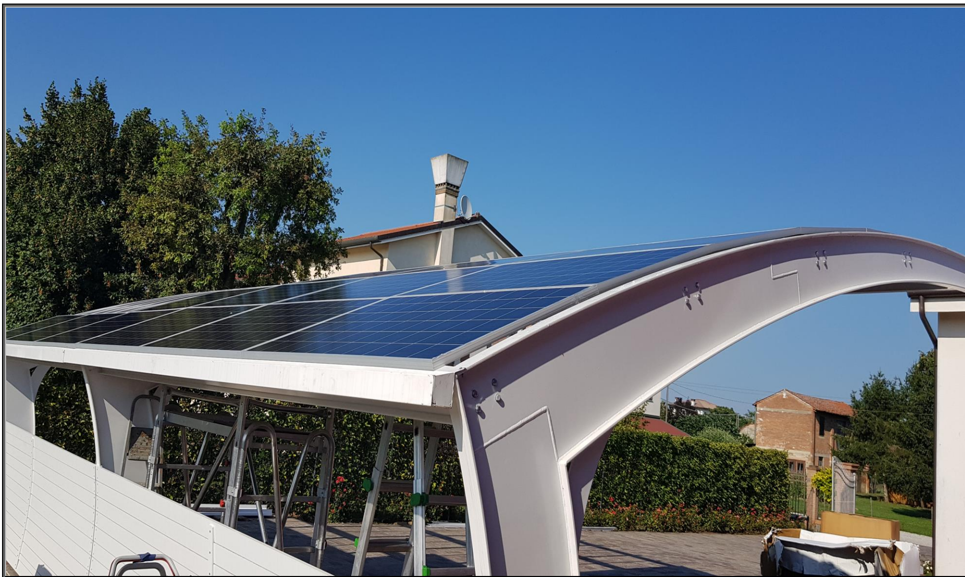
MODELLO: E-ONDA XL - COPERTURA: FOTOVOLTAICO 9.9 kWp - OPTIONAL: COLONNINA DI RICARICA/SISTEMA DI ILLUMINAZIONE LED