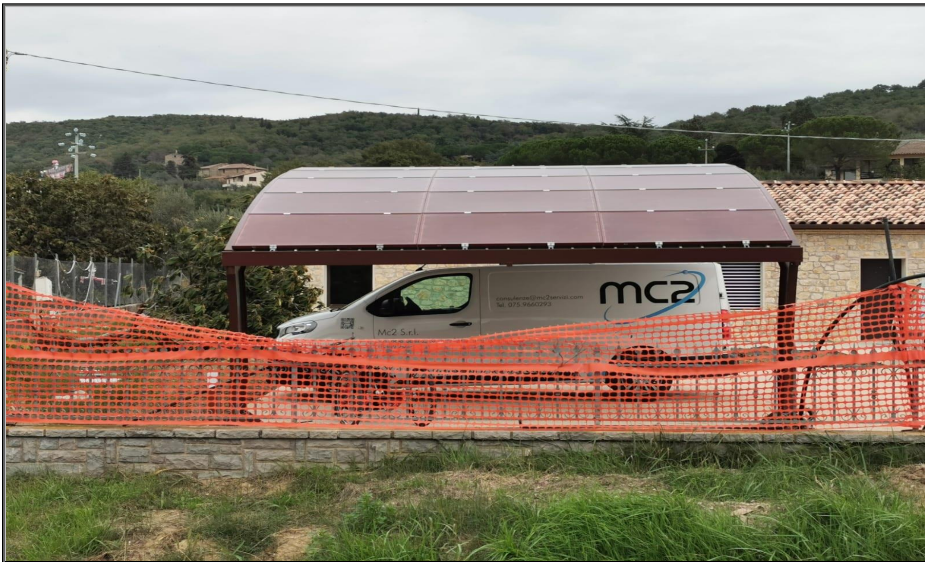
MODELLO: E-ONDA XL – COPERTURA: FOTOVOLTAICO 5.9 kWp