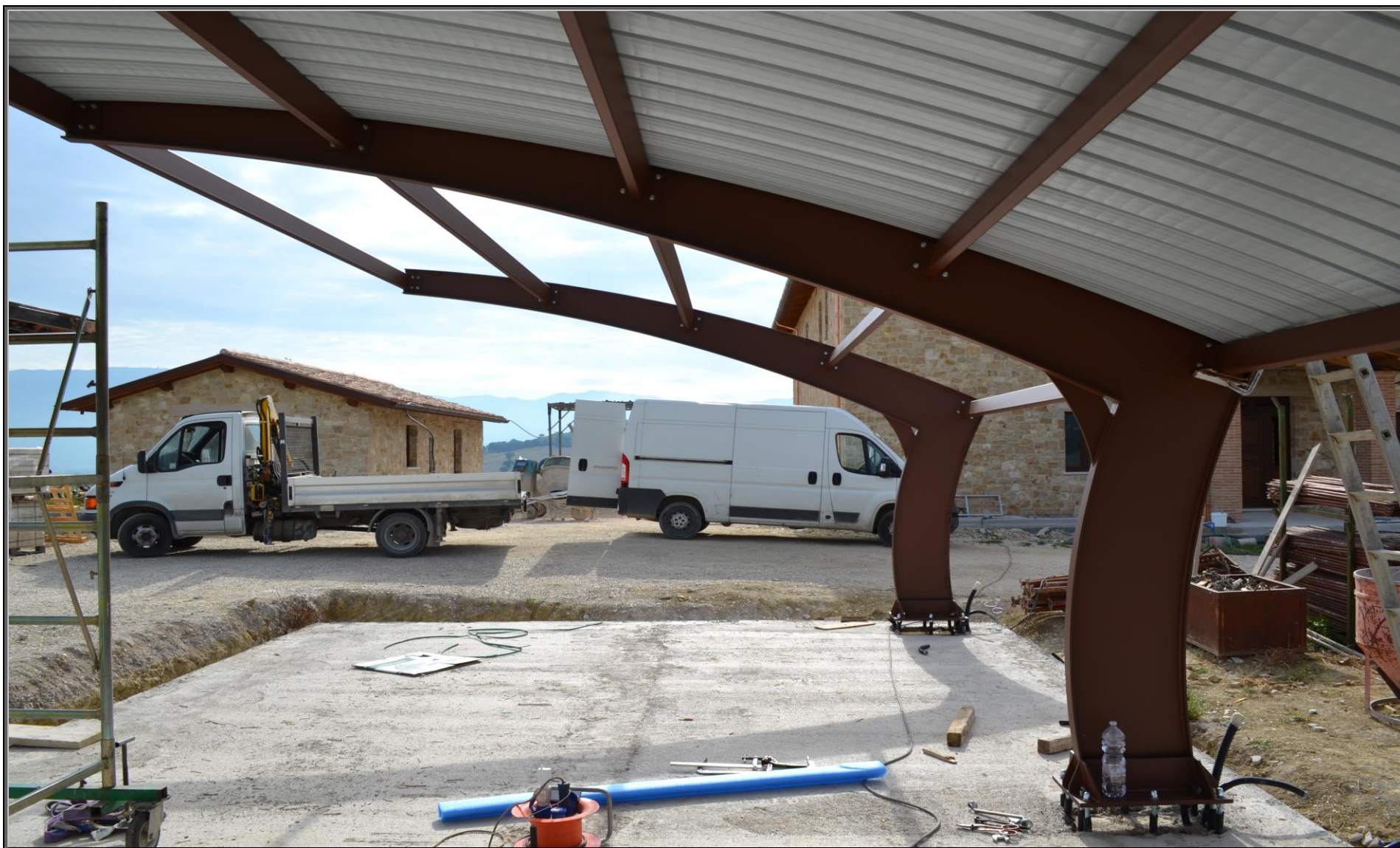
MODELLO: E-ONDA BASIC – COPERTURA: FOTOVOLTAICO 10.0 kWp