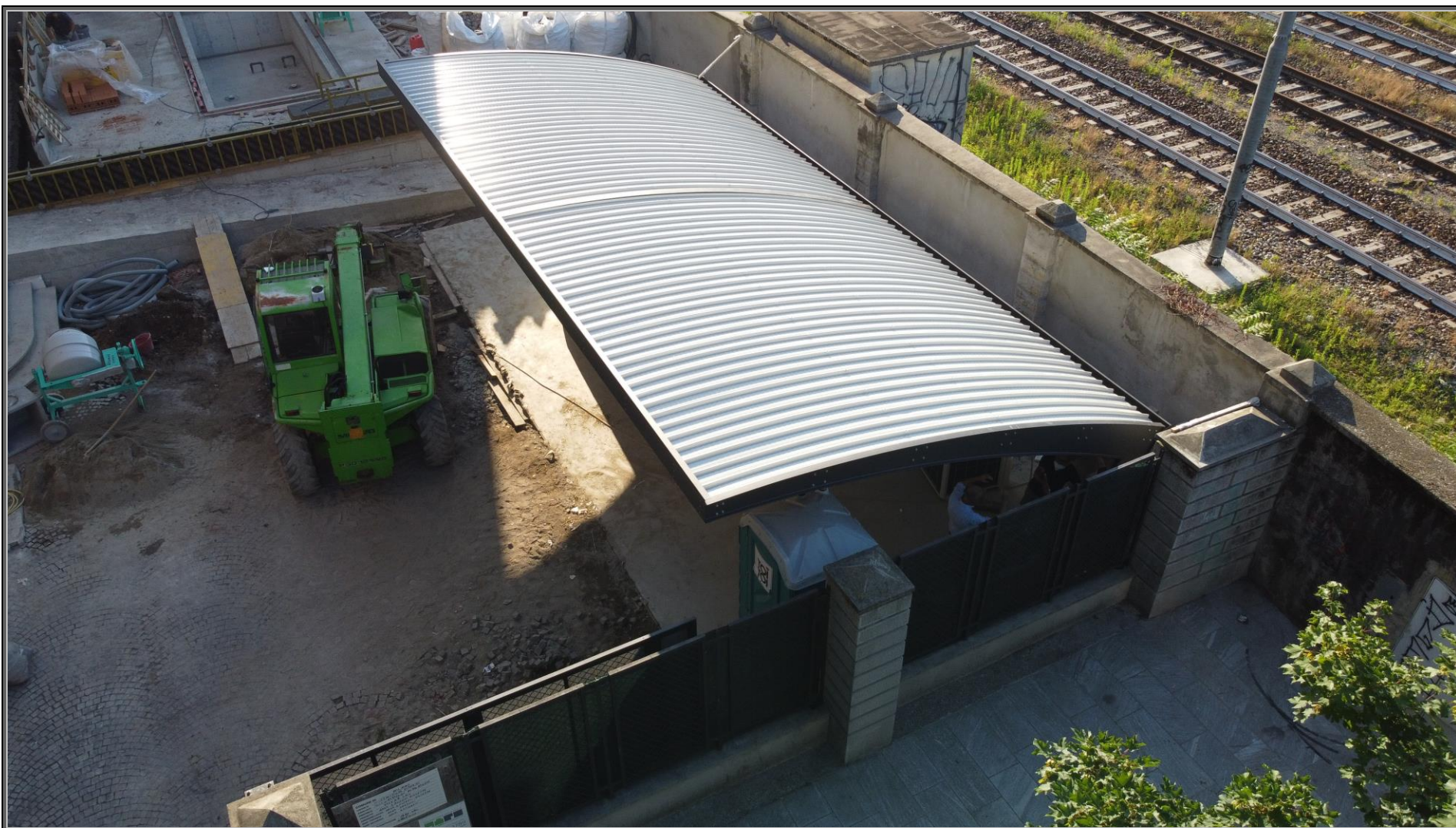
MODELLO: E-ONDA XXL – COPERTURA: FOTOVOLTAICO 13.7 kWp