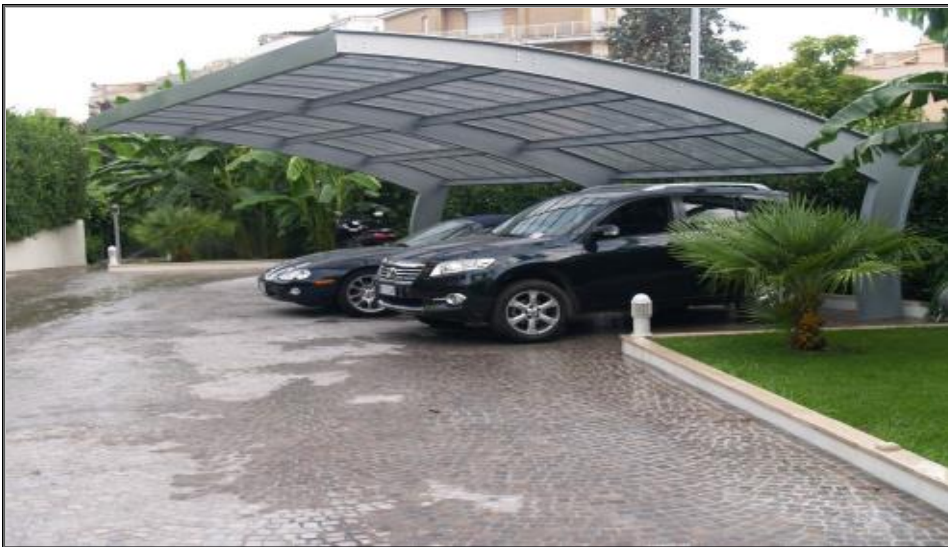
MODELLO: E-ONDA XL – COPERTURA: FOTOVOLTAICO 10.8 kWp