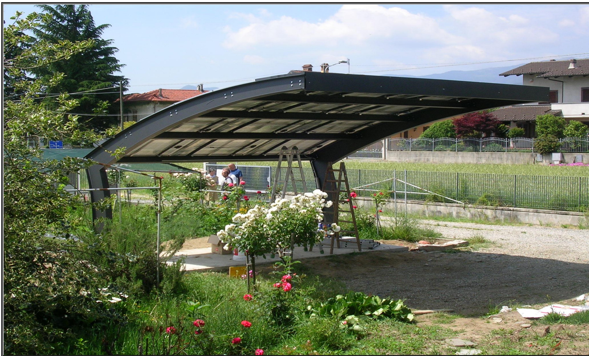
MODELLO: E-ONDA BASIC – COPERTURA: FOTOVOLTAICO 4.9 kWp