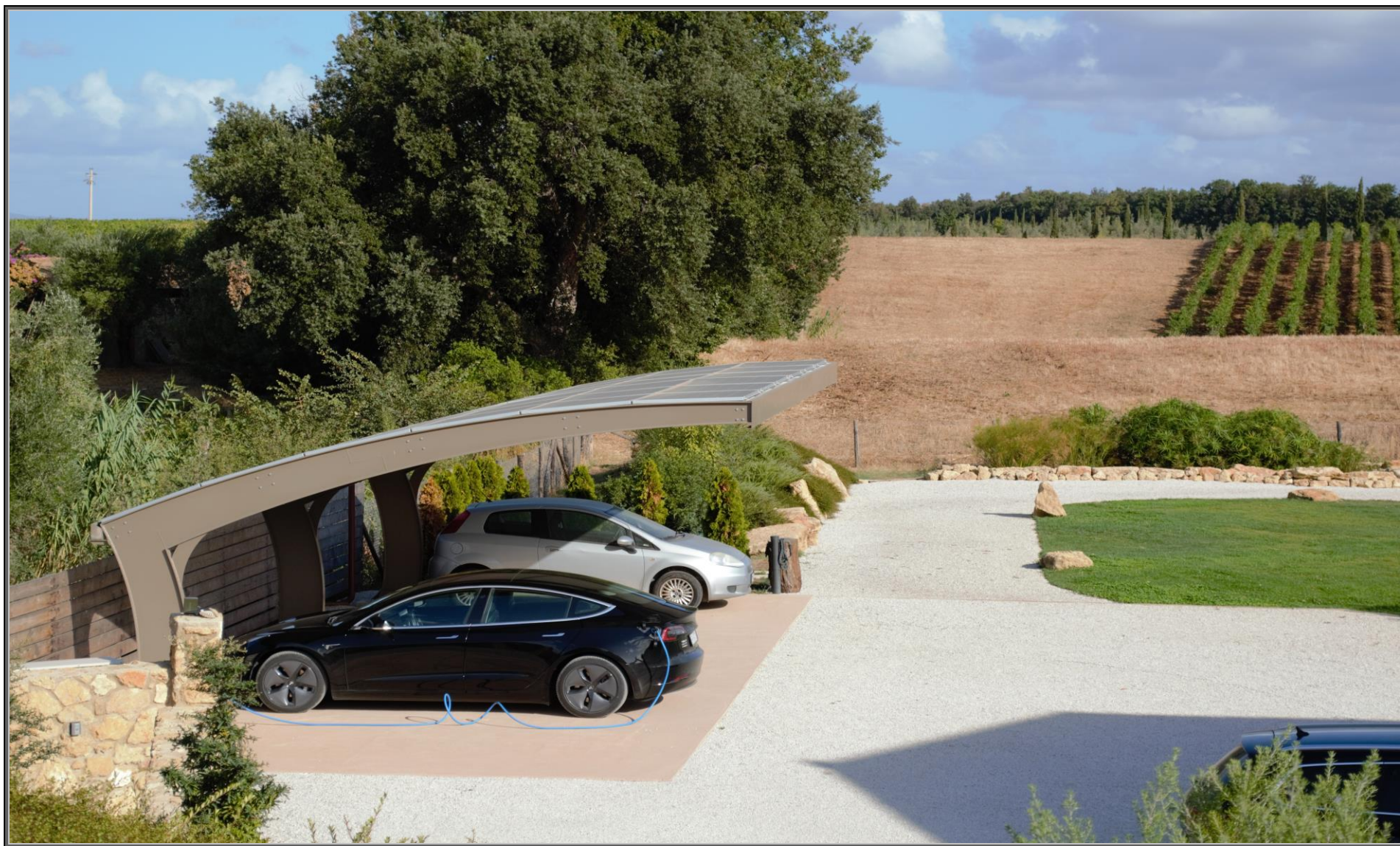
MODELLO: E-ONDA XL – COPERTURA: FOTOVOLTAICO 11.9 kWp