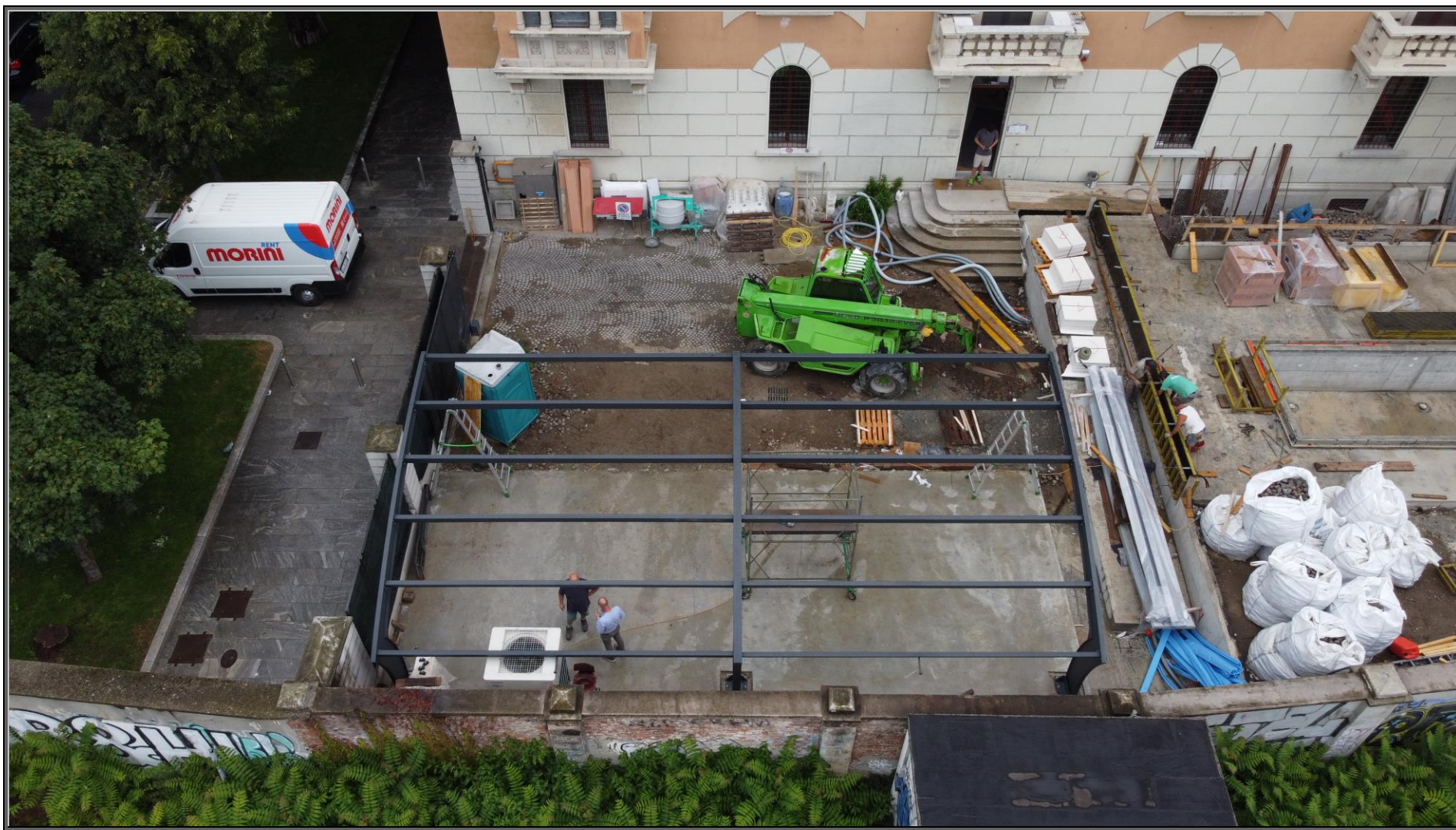
MODELLO: E-ONDA XXL – COPERTURA: FOTOVOLTAICO 13.7 kWp