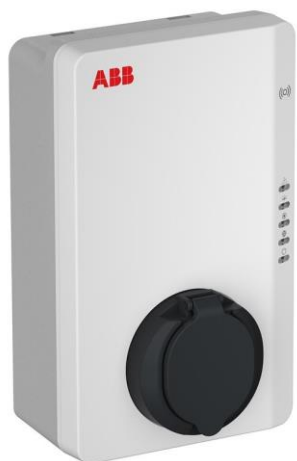
Sistema di ricarica per veicoli elettrici