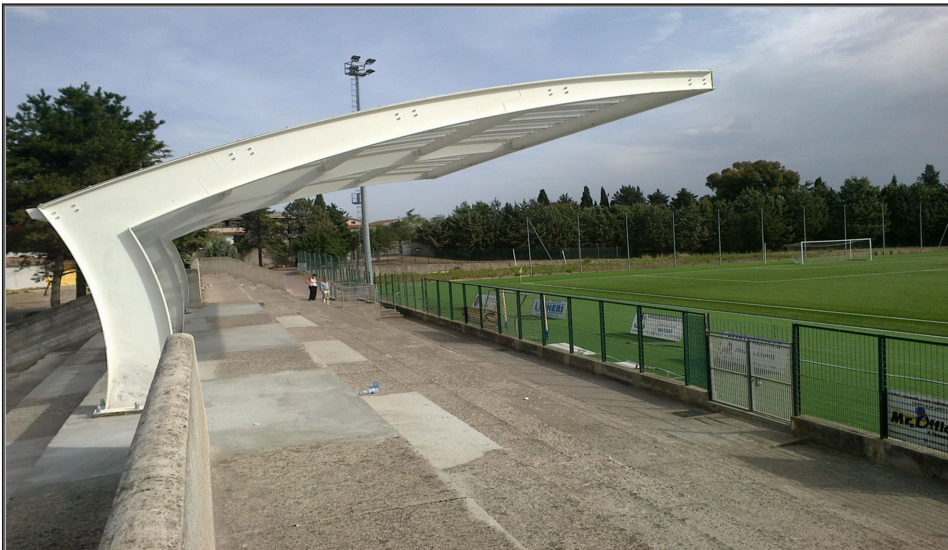
MODELLO: ONDA BASIC – COPERTURA: POLICARBONATO 4mm