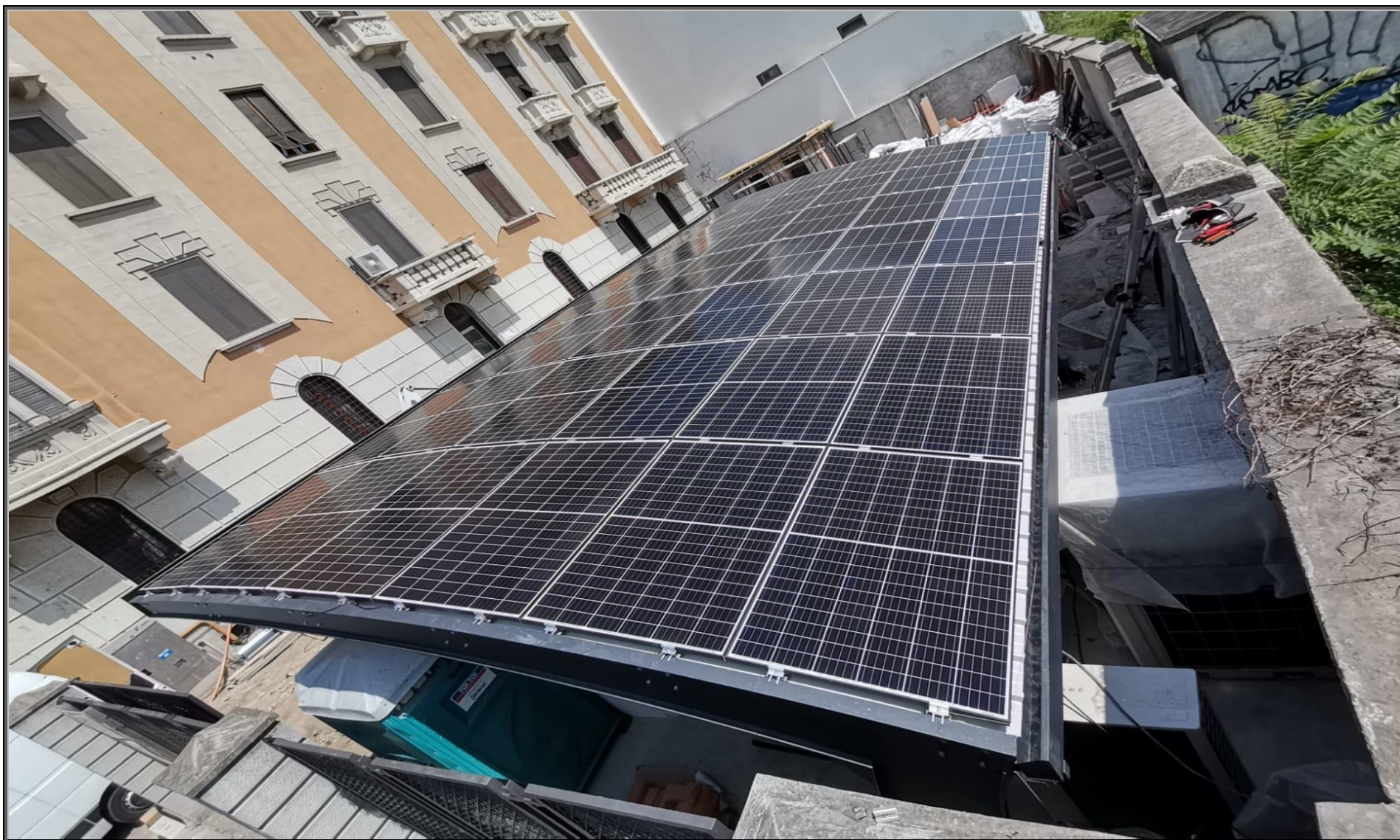
MODELLO: E-ONDA XXL – COPERTURA: FOTOVOLTAICO 13.7 kWp