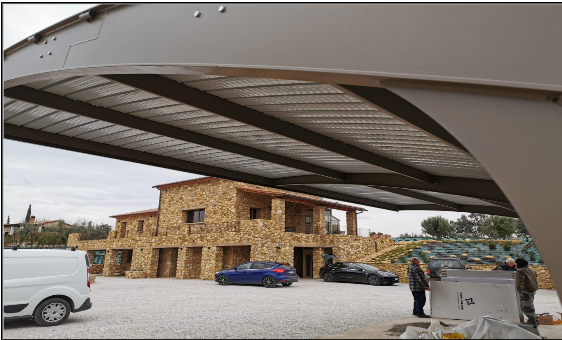
MODELLO: E-ONDA XL – COPERTURA: FOTOVOLTAICO 11.9 kWp