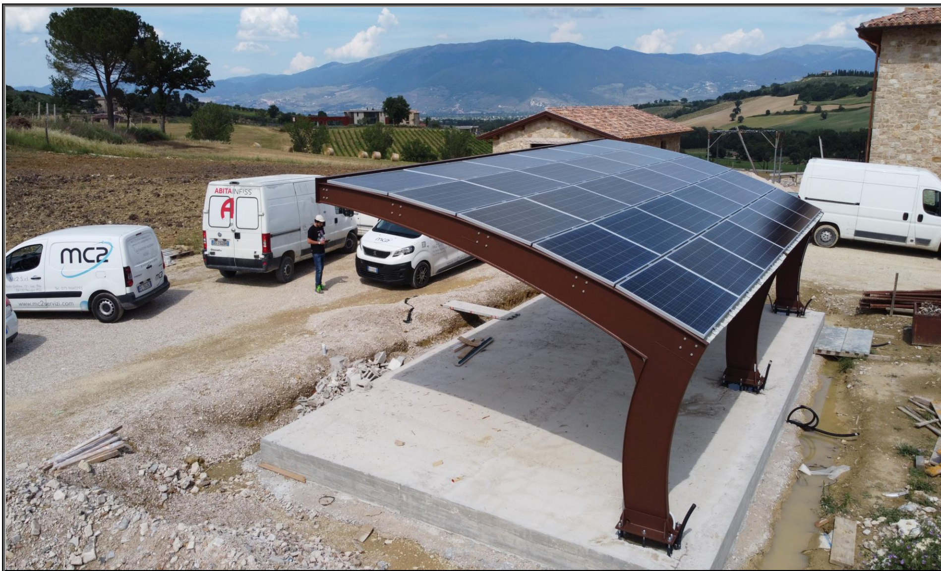
MODELLO: E-ONDA BASIC – COPERTURA: FOTOVOLTAICO 10.0 kWp