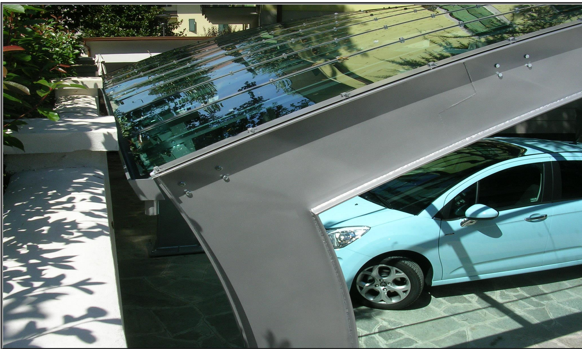
MODELLO: ONDA XL – COPERTURA: POLICARBONATO 4mm