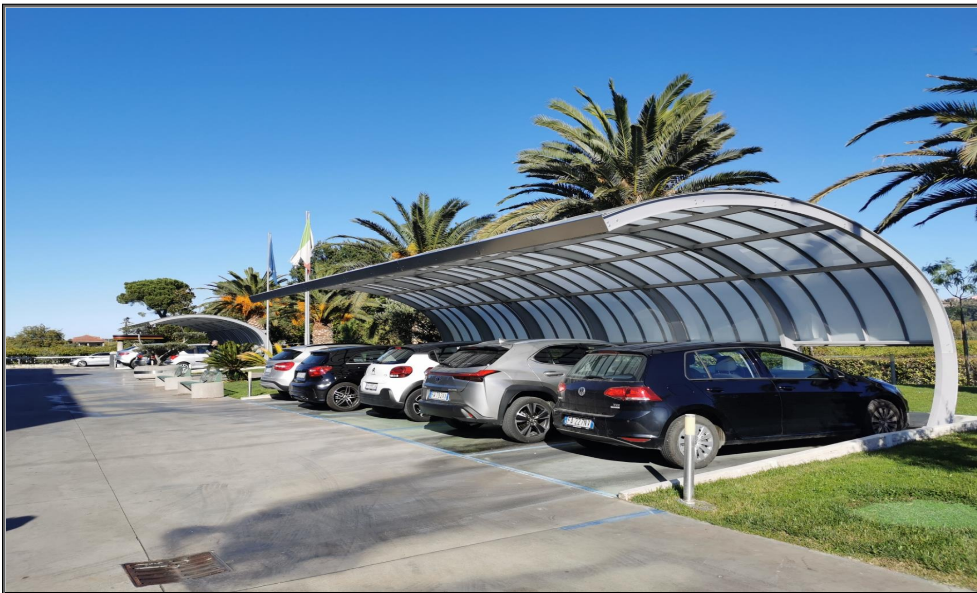
MODELLO: CARSELL - COPERTURA: POLICARBONATO