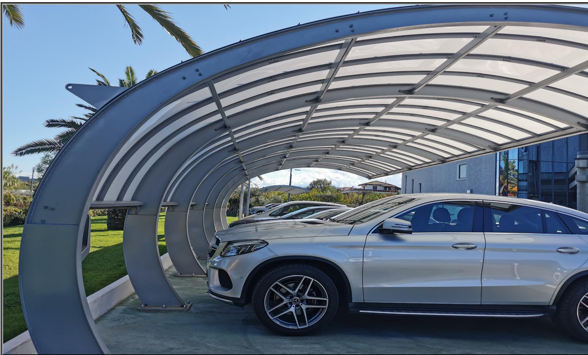
MODELLO: CARSELL - COPERTURA: POLICARBONATO