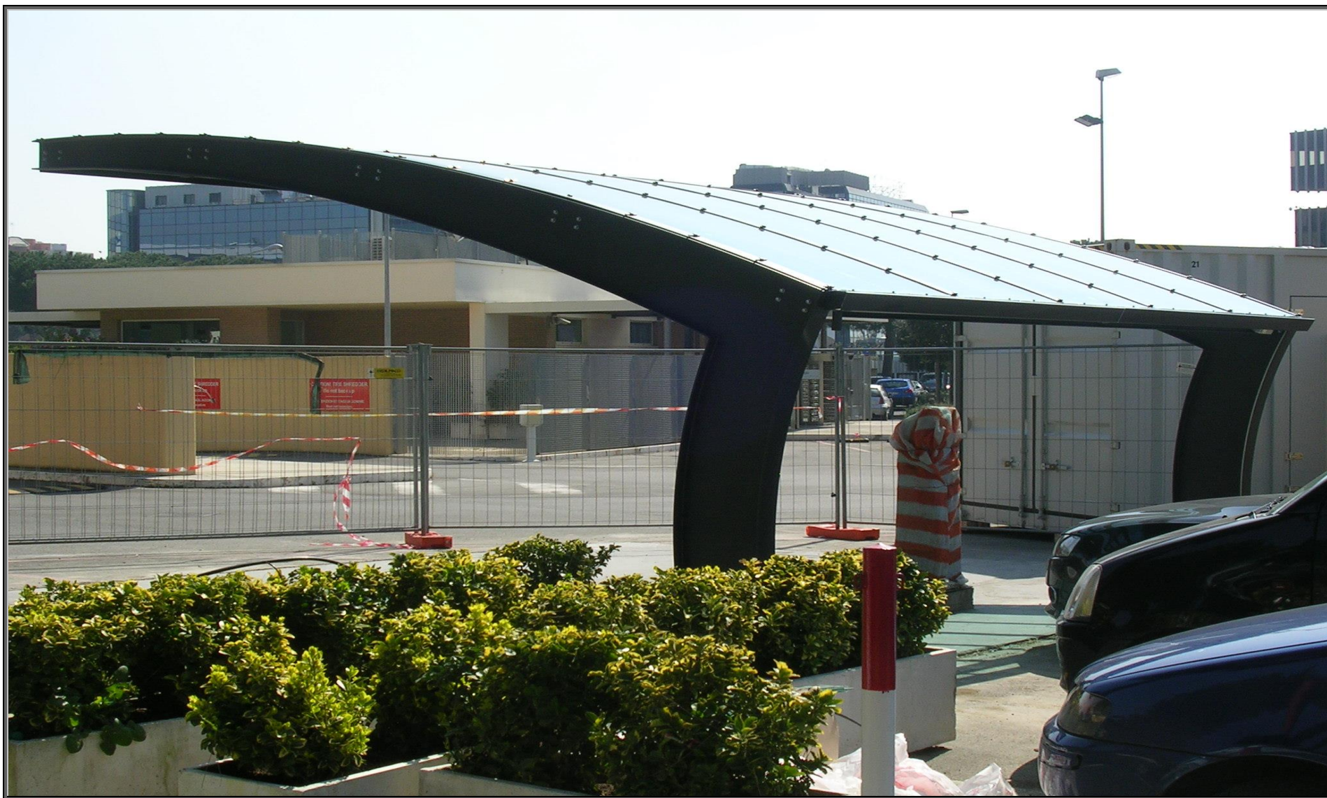
MODELLO: ONDA BASIC – COPERTURA: POLICARBONATO 4mm