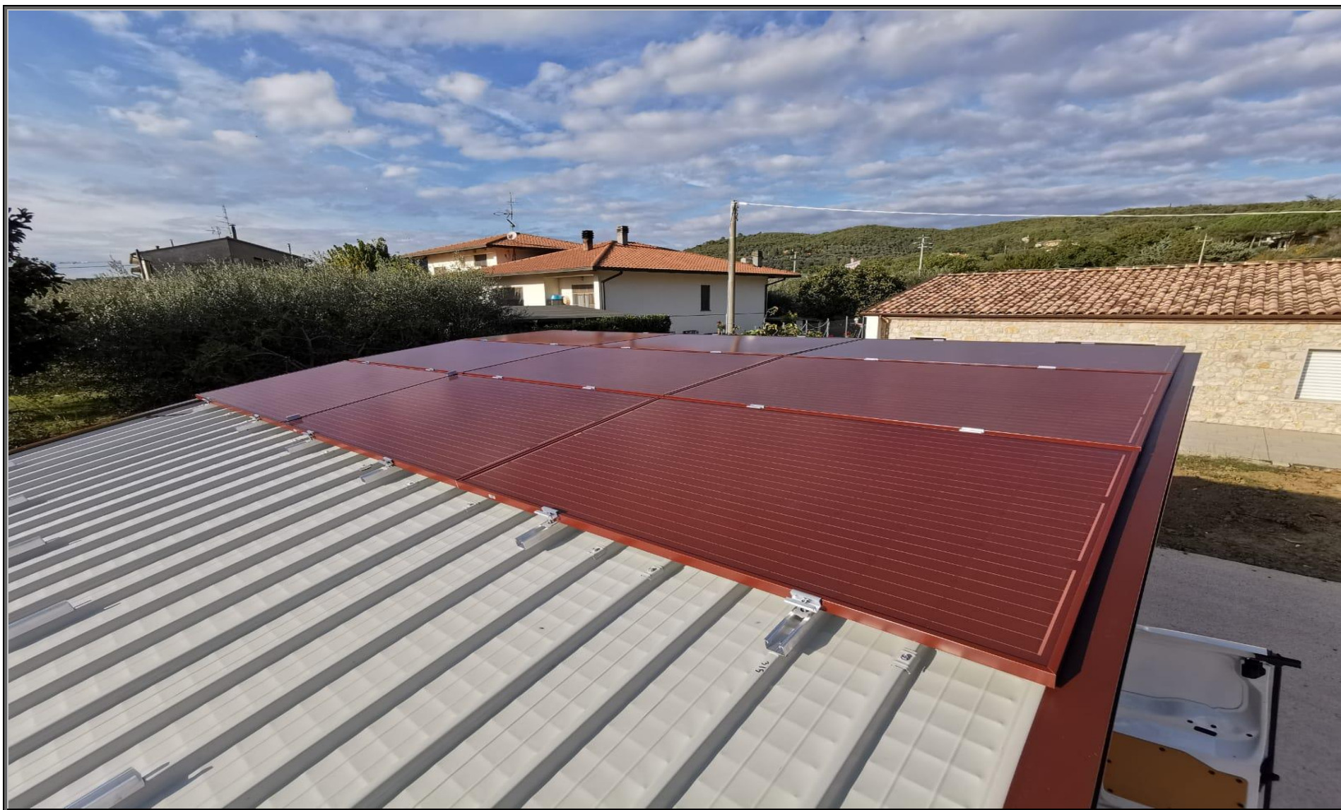
MODELLO: E-ONDA XL – COPERTURA: FOTOVOLTAICO 5.9 kWp