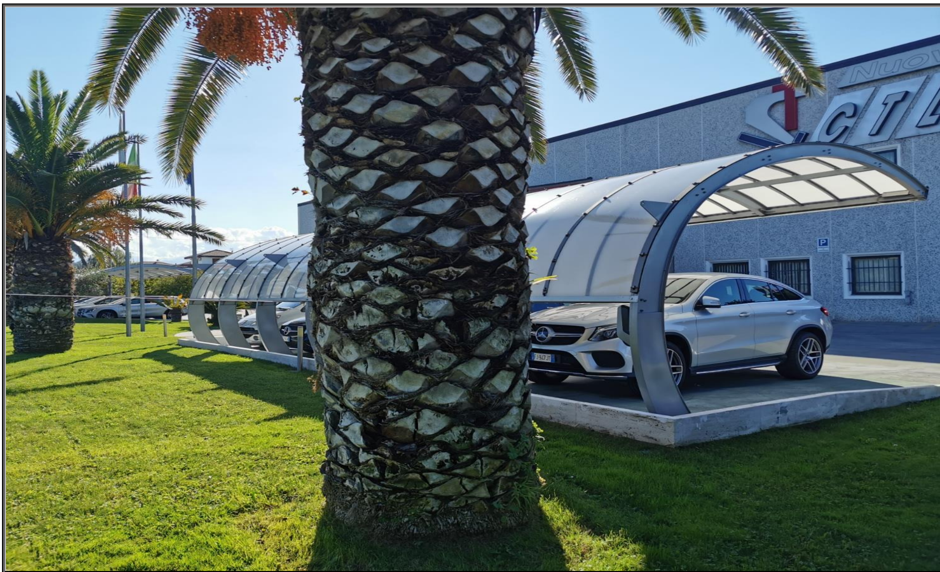
MODELLO: CARHELL - COPERTURA: POLICARBONATO – OPTIONAL: WALL BOX 7kWp