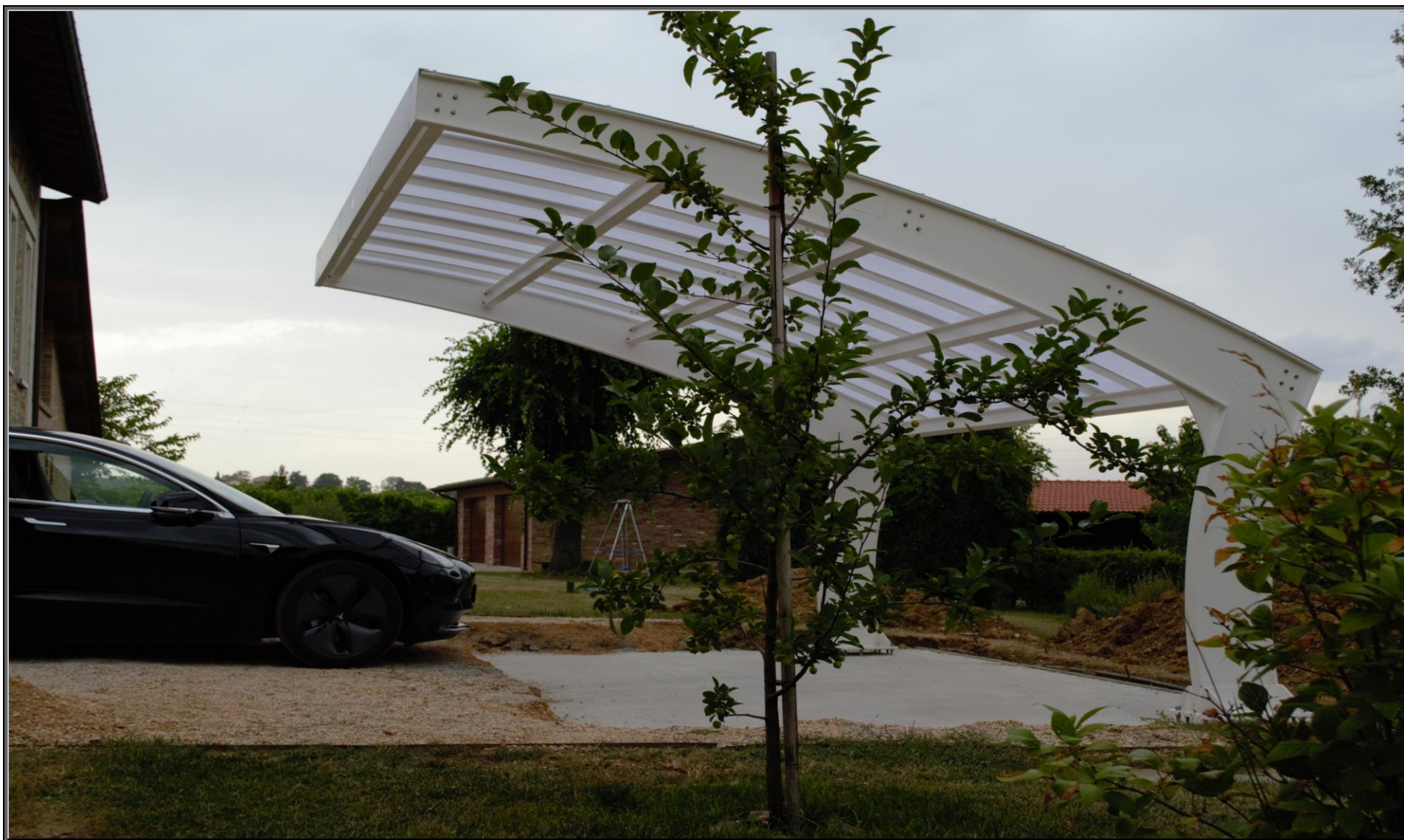
MODELLO: ONDA BASIC – COPERTURA: POLICARBONATO 4mm