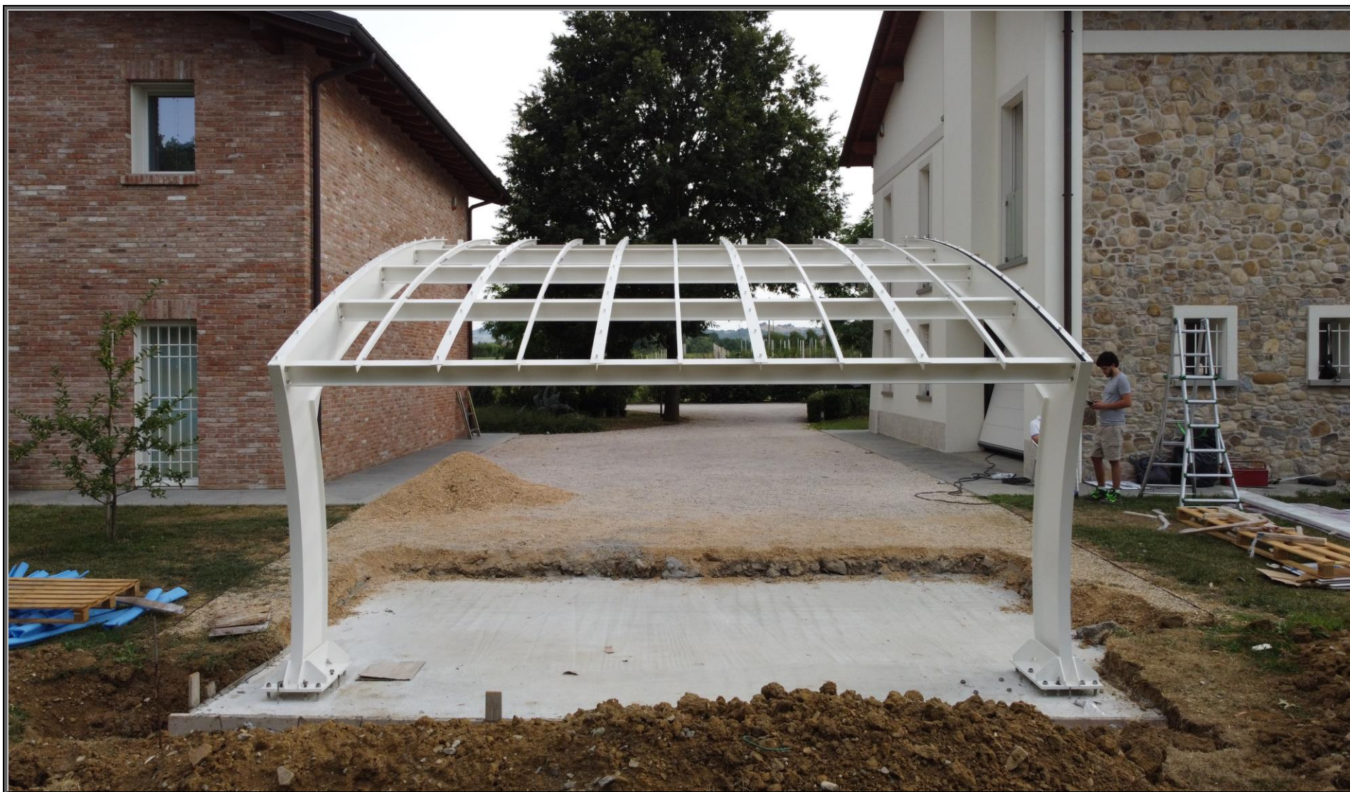
MODELLO: ONDA XL – COPERTURA: FOTOVOLTAICO 11.9 kWp