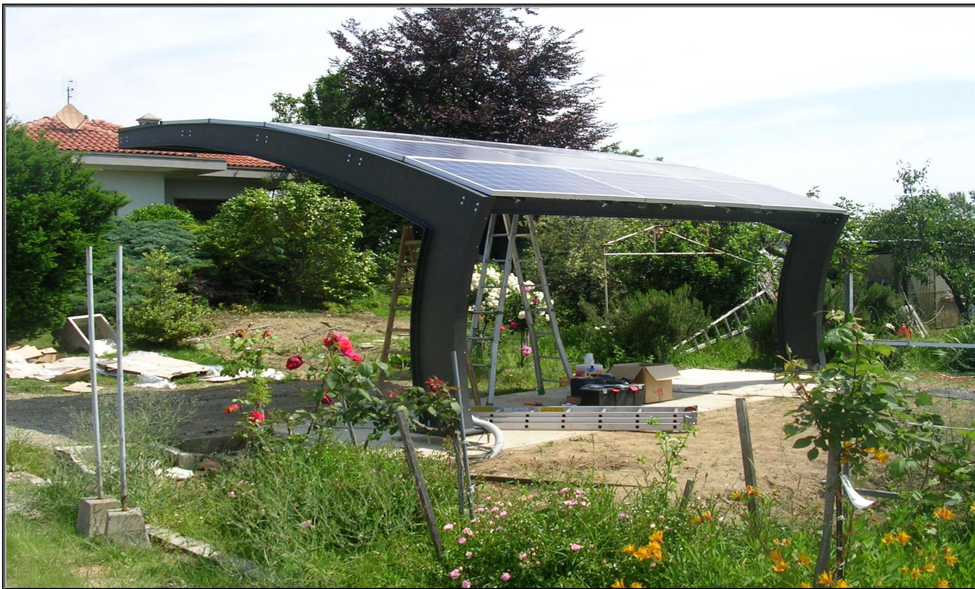
MODELLO: E-ONDA BASIC – COPERTURA: FOTOVOLTAICO 4.9 kWp