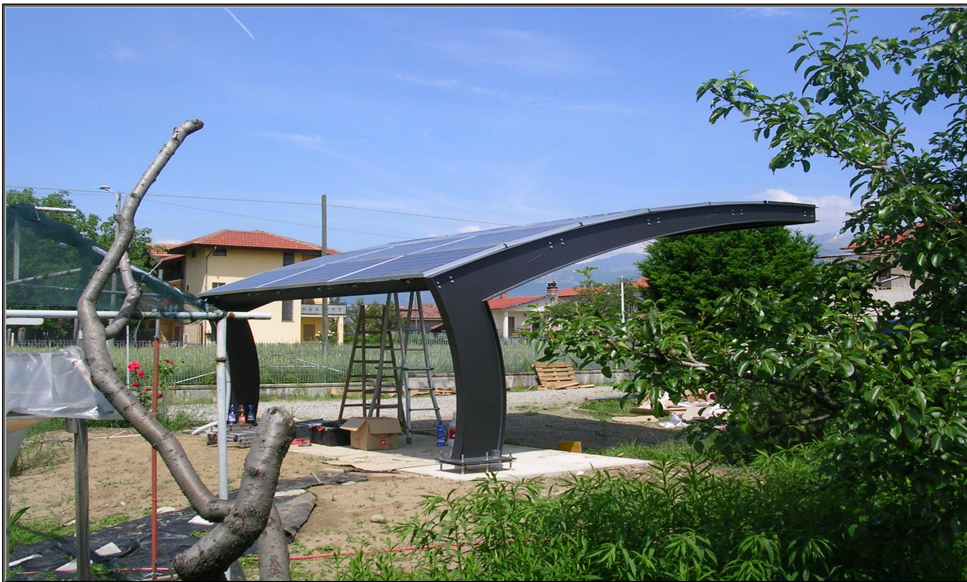
MODELLO: E-ONDA BASIC – COPERTURA: FOTOVOLTAICO 4.9 kWp