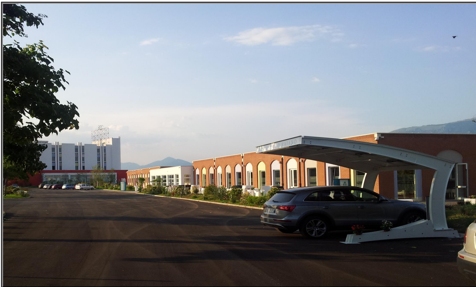
MODELLO: E-ONDA ONE SIDE – COPERTURA: FOTOVOLTAICO 3.9 kWp