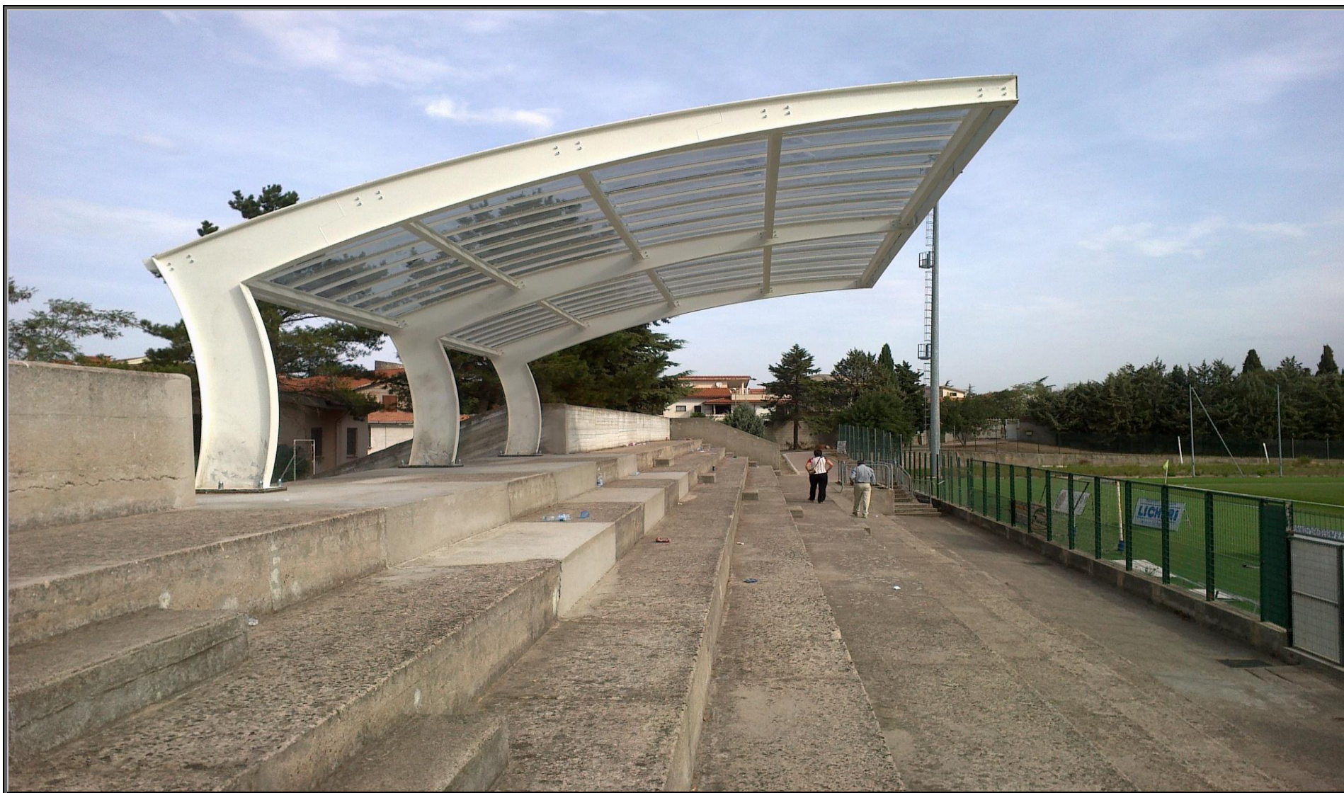
MODELLO: ONDA BASIC – COPERTURA: POLICARBONATO 4mm