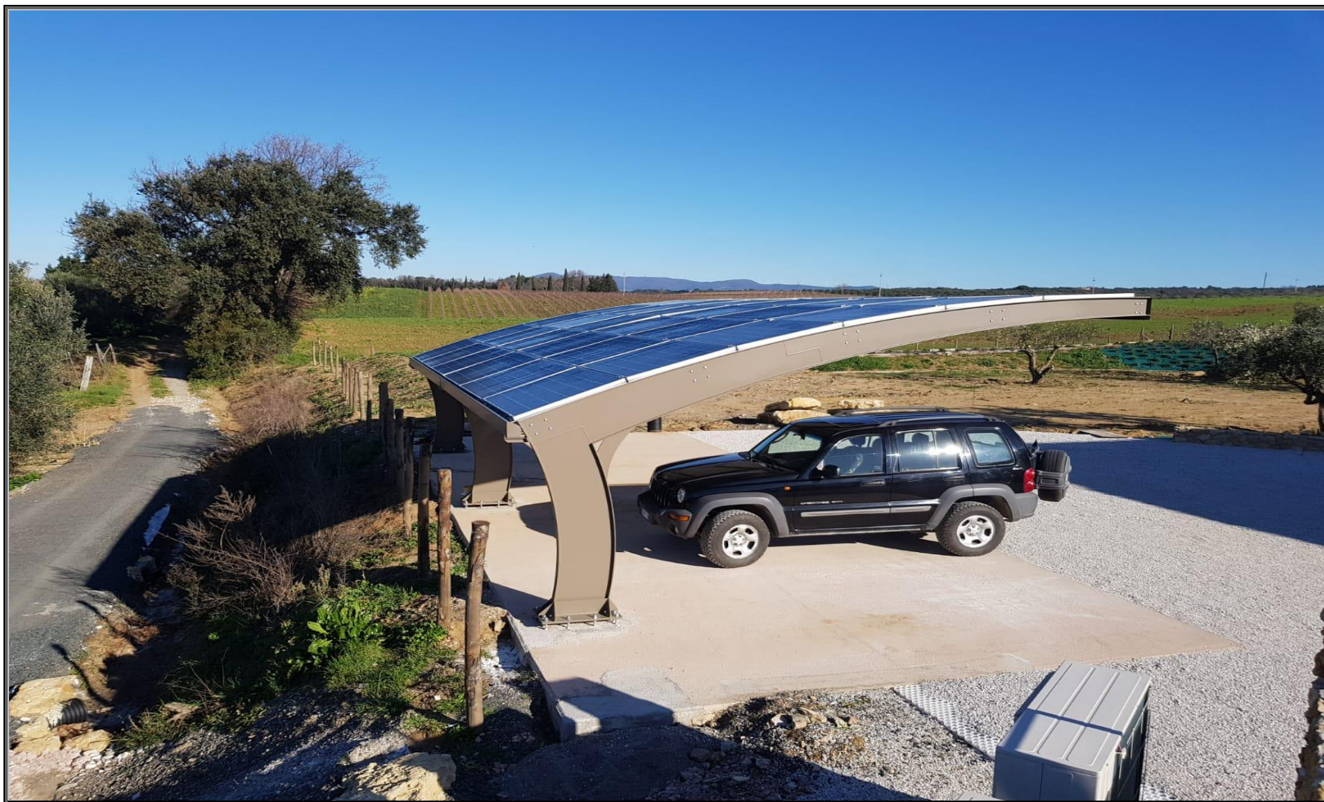
MODELLO: E-ONDA XL – COPERTURA: FOTOVOLTAICO 11.9 kWp