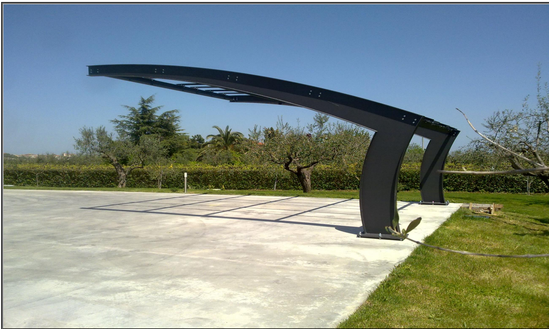
MODELLO: ONDA BASIC – COPERTURA: POLICARBONATO 4mm