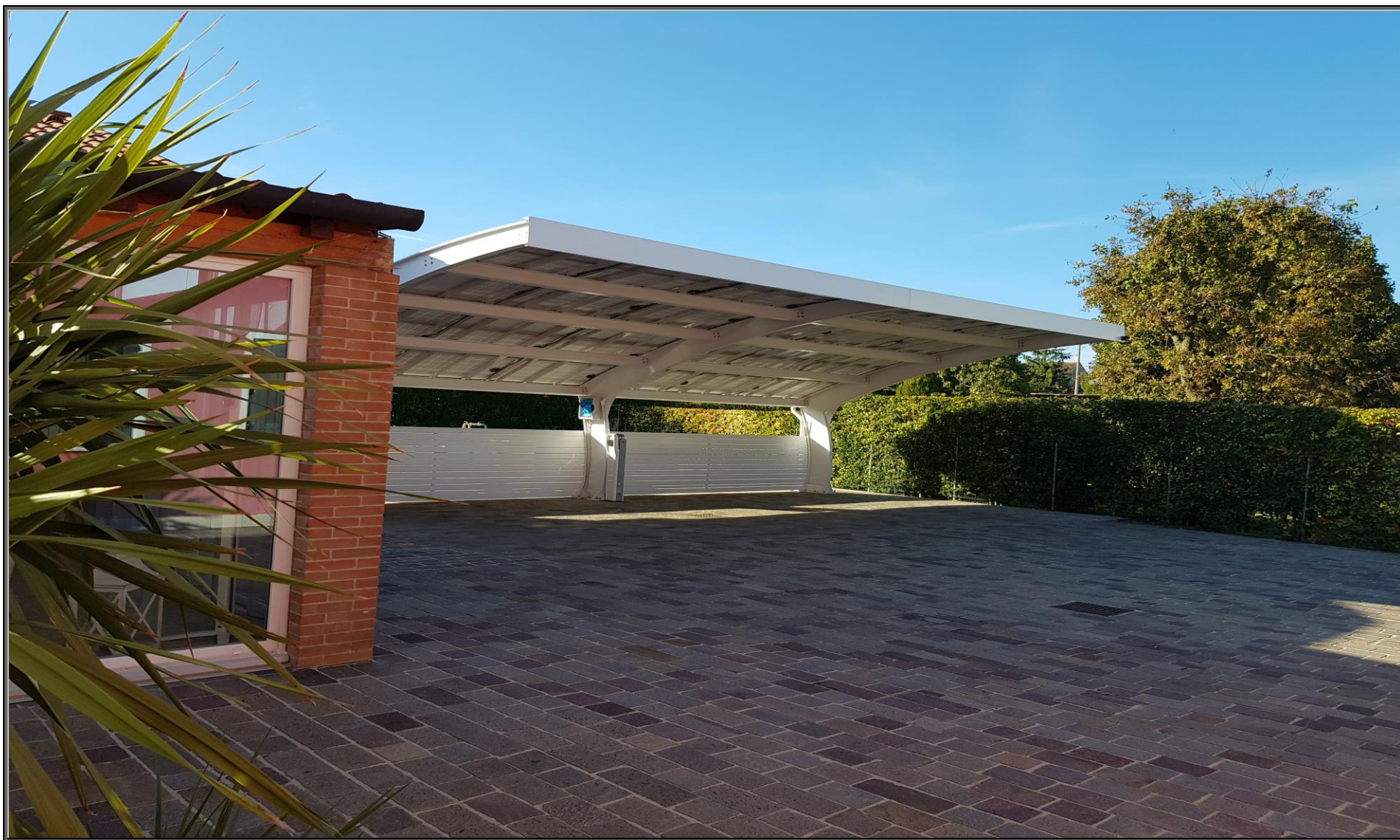
MODELLO: E-ONDA XL - COPERTURA: FOTOVOLTAICO 9.9 kWp - OPTIONAL: COLONNINA DI RICARICA/SISTEMA DI ILLUMINAZIONE LED