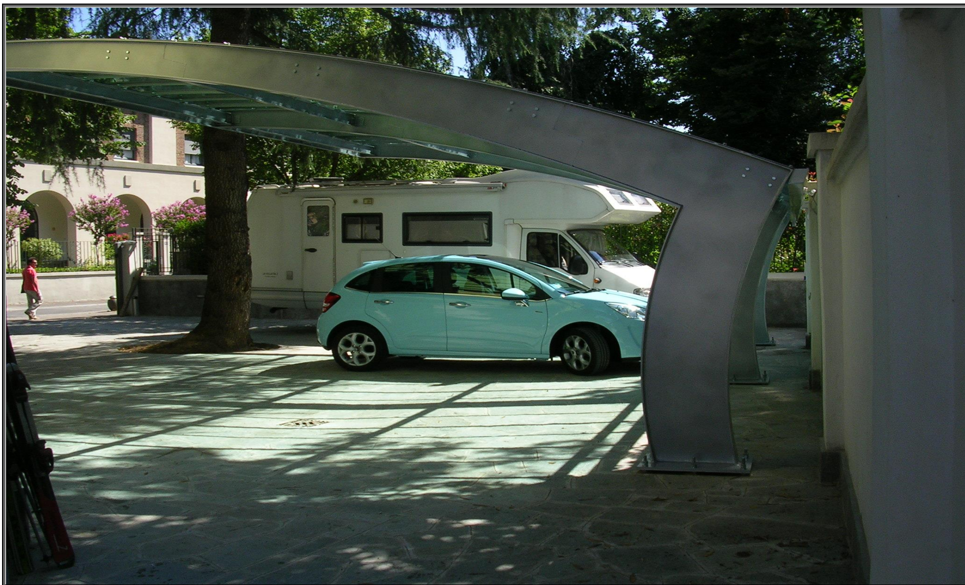
MODELLO: ONDA XL – COPERTURA: POLICARBONATO 4mm