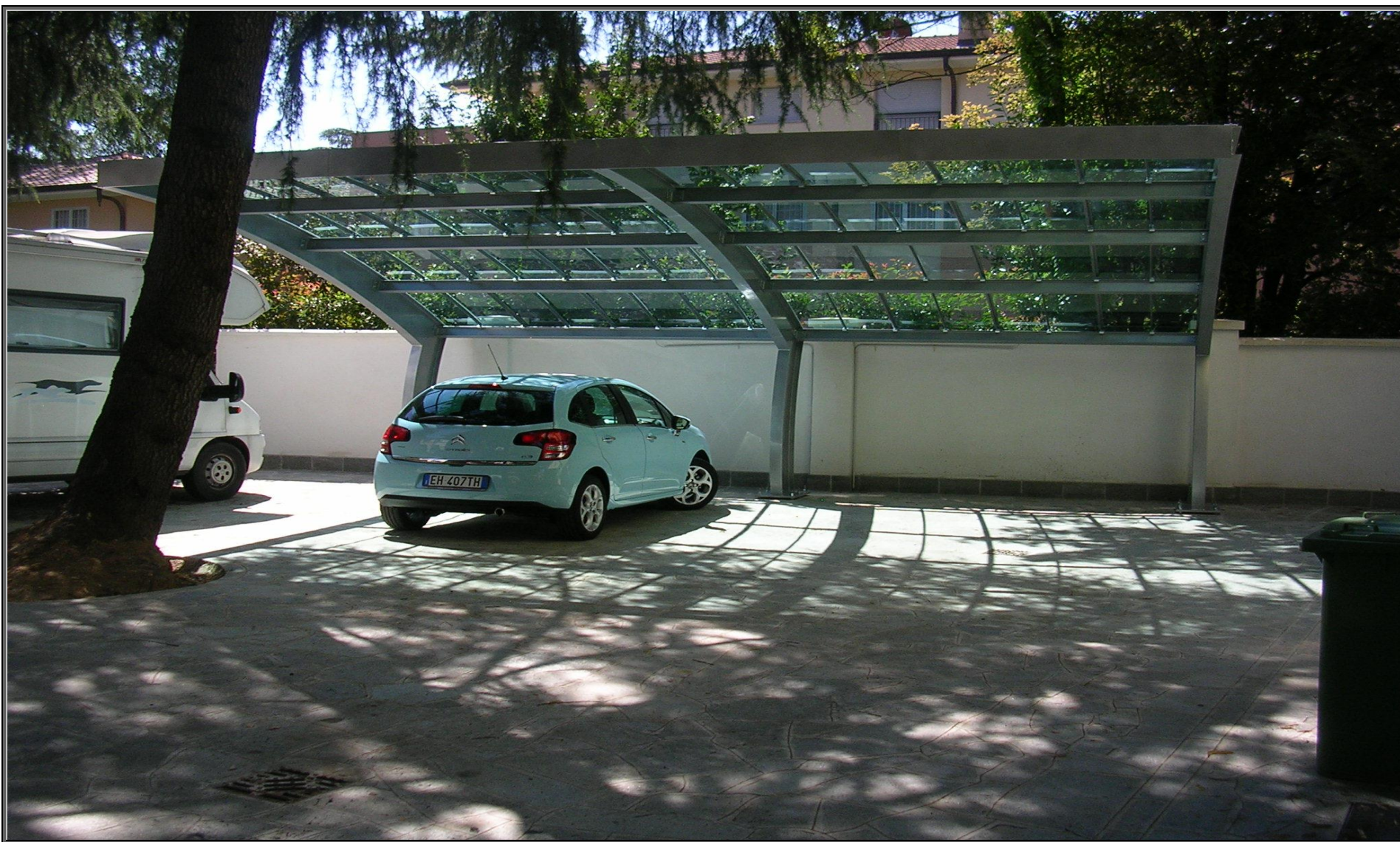
MODELLO: ONDA XL – COPERTURA: POLICARBONATO 4mm