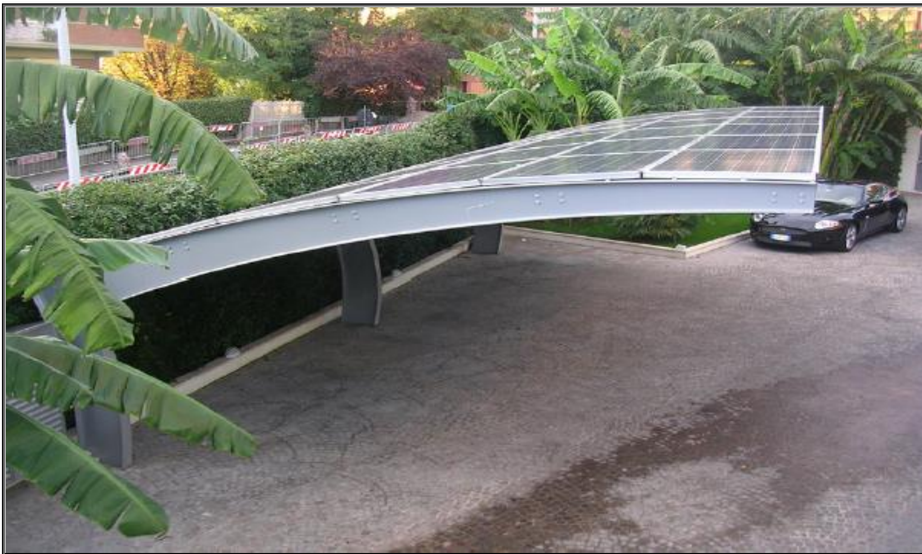
MODELLO: E-ONDA XL – COPERTURA: FOTOVOLTAICO 10.8 kWp