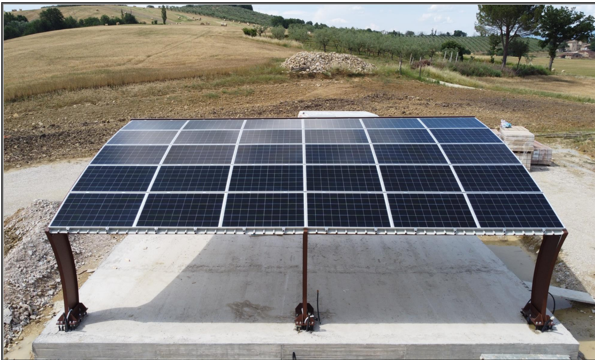
MODELLO: E-ONDA BASIC – COPERTURA: FOTOVOLTAICO 10.0 kWp