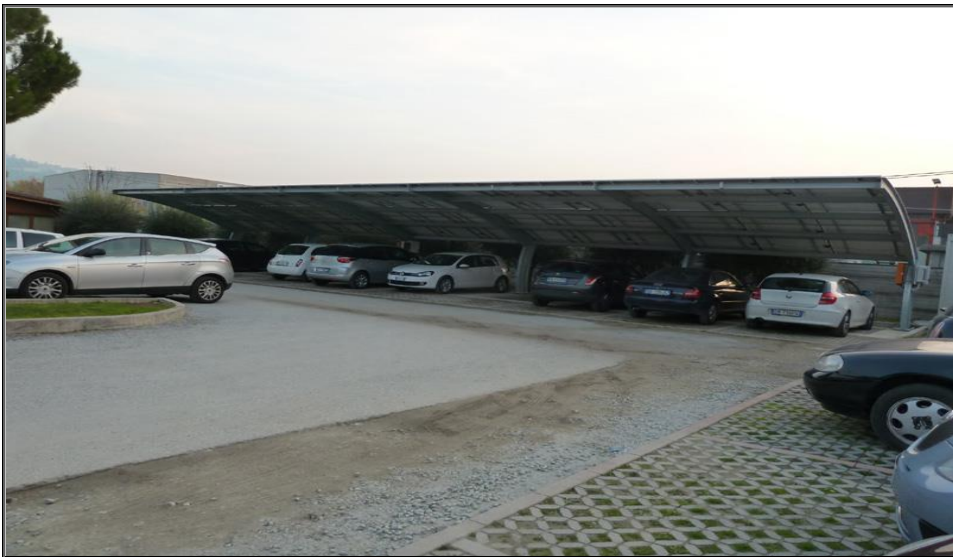
MODELLO: E-ONDA BASIC – COPERTURA: FOTOVOLTAICO 22,5 kWp