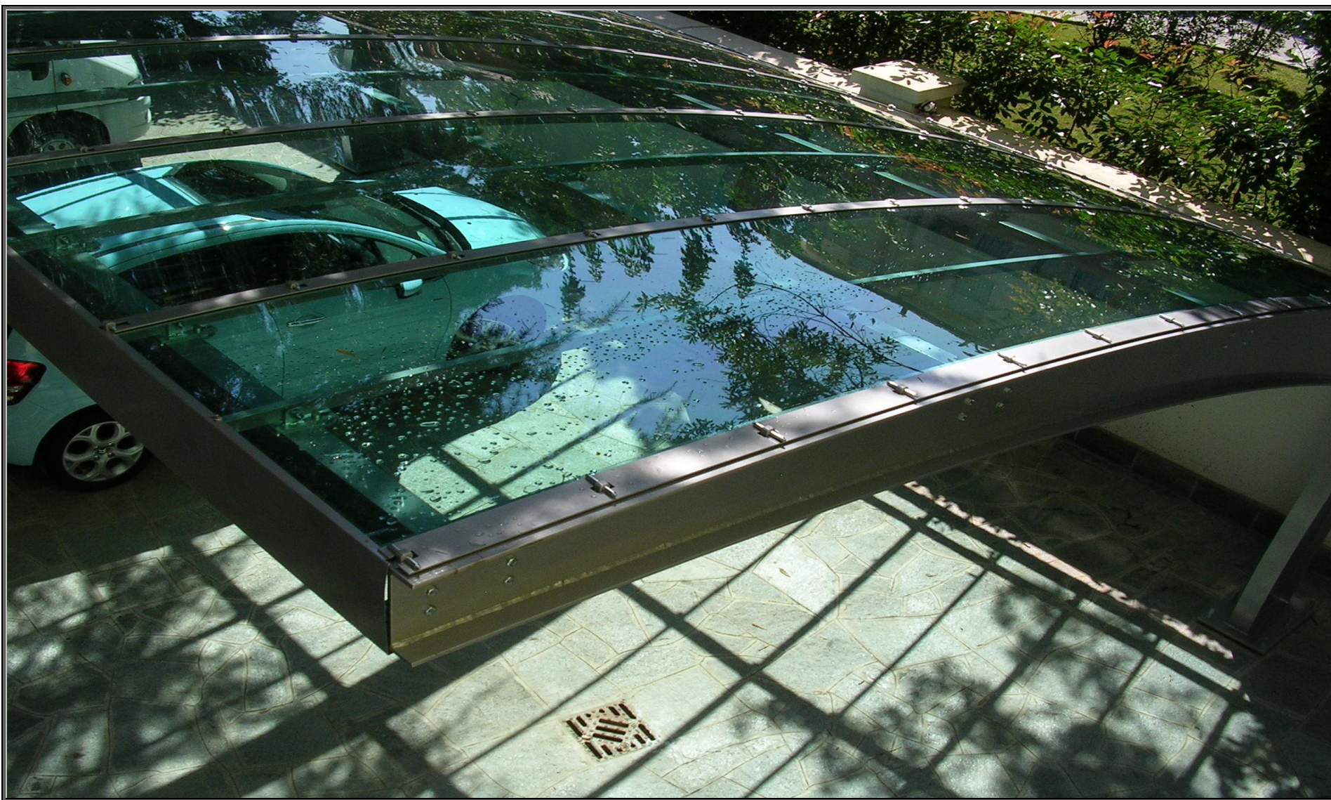
MODELLO: ONDA XL – COPERTURA: POLICARBONATO 4mm